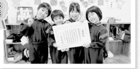
都呂々保育園幼年消防クラブ(苓北町)