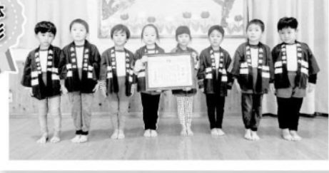
宮原保育園幼年消防クラブ(苓北町)