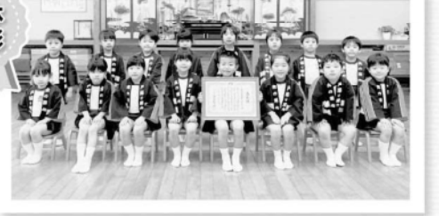
富岡保育園幼年消防クラブ(苓北町)